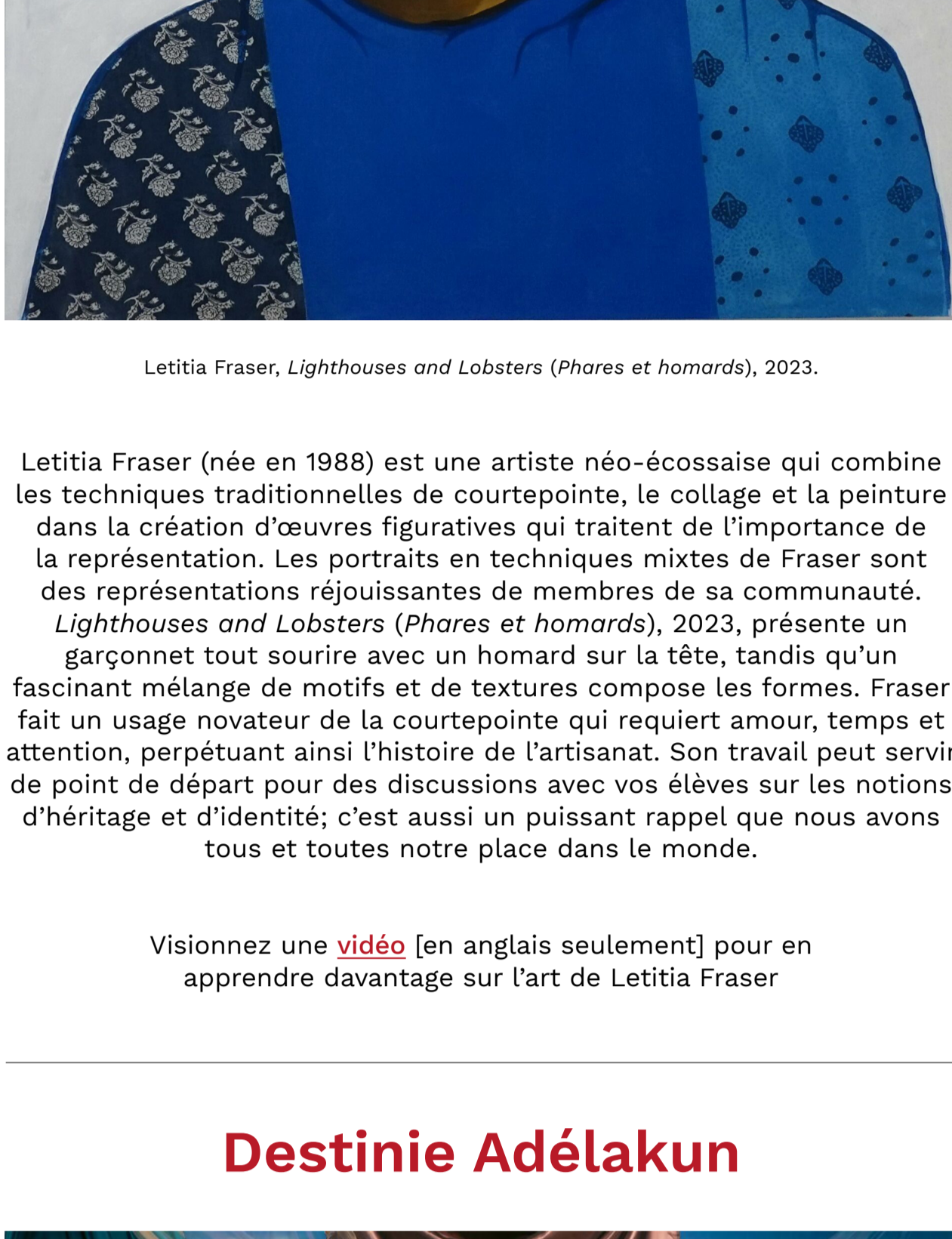
Letitia Fraser, Lighthouses and Lobsters (Phares et homards) , 2023.

Letitia Fraser (née en 1988) est une artiste néo-écossaise qui combine les techniques traditionnelles de courtpeinte, le collage et la peinture dans la création d'œuvres figuratives qui traitent de l'importance de la représentation. Les portraits en techniques mixtes de Fraser sont des représentations réjouissantes de membres de sa communauté.