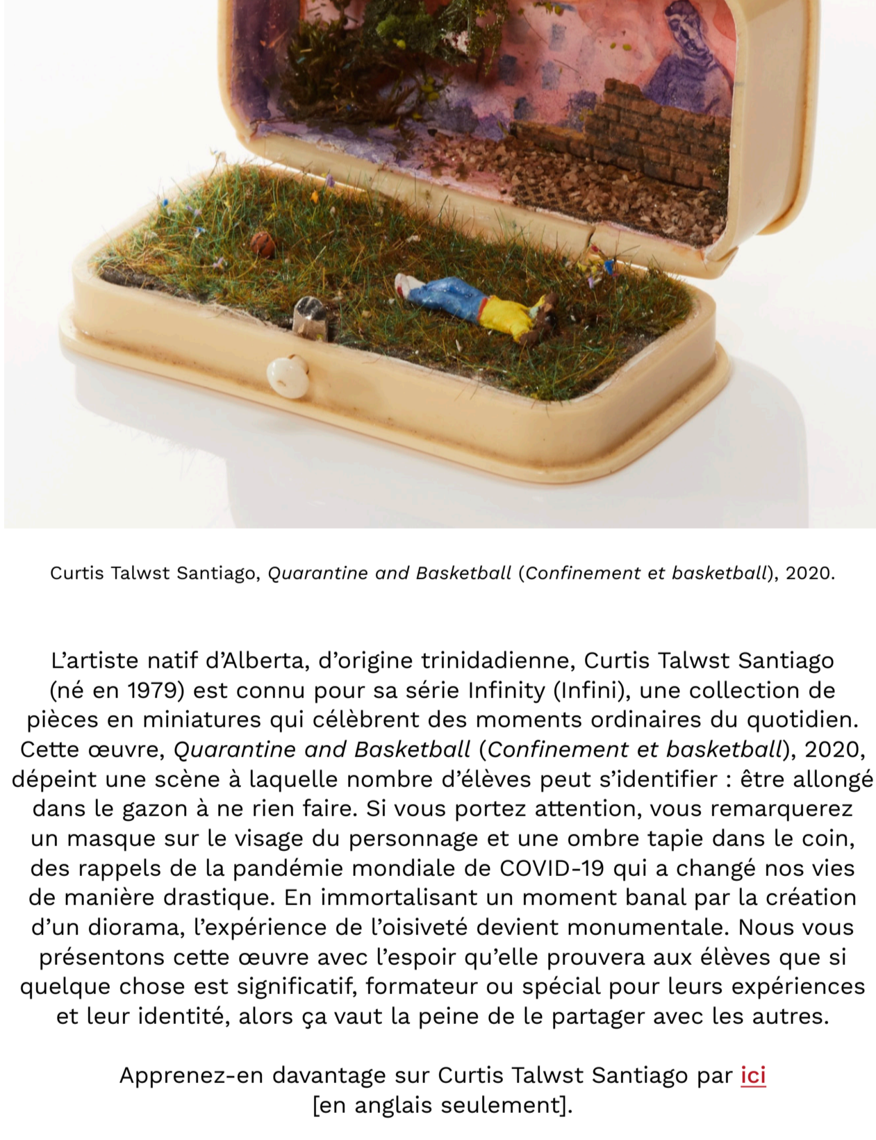
Anthony Gebrehiwot, The Power of a Hug (La puissance d'un câlin) , 2020.

L'artiste de Scarborough, en Ontario, Anthony Gebrehiwot (né en 1989), explore le potentiel de la photographie d'outil de transformation sociale. En créant des images empreintes d'empathie, qui invitent le public à se connecter émotionnellement aux sujets, Gebrehiwot contrecarre les stéréotypes de la masculinité noire, plus particulièrement les représentations déshumanisantes des hommes noirs répandues dans les médias nord-américains. Ses portraits, comme The Power of a Hug (La puissance d'un câlin) , 2020, sont réfléchis et tendres, et reflètent le fort engagement de l'artiste envers sa communauté. Nous vous présentons cette image, qui donne à voir un échange bienveillant, pour inspirer des discussions en classe sur la vulnérabilité, la guérison et l'authenticité, et montrer aux élèves des exemples significatifs de masculinité noire.