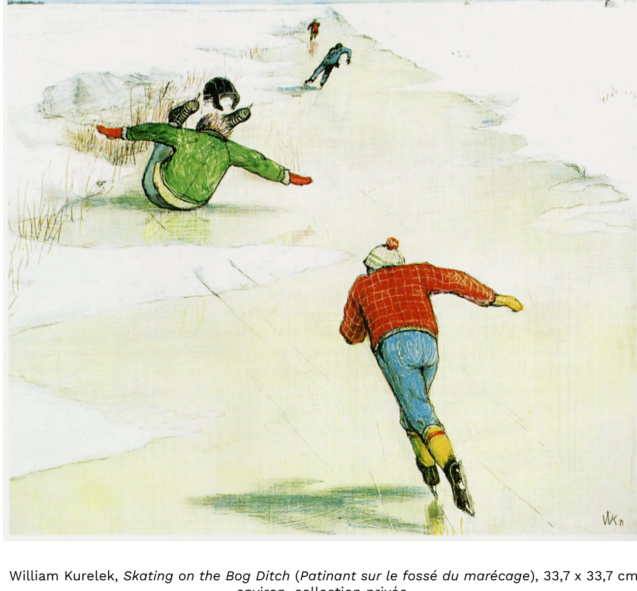
William Kurelek, Skating on the Bog Ditch (Patinant sur le fossé du marécage) , 33,7 x 33,7 cm environ, collection privée.

Pour notre dernière infolettre de l'année, nous souhaitons à toute la communauté en éducation d'heureuses fêtes de fin d'année, et nous vous donnons des nouvelles de la prochaine édition de notre défi étudiant!